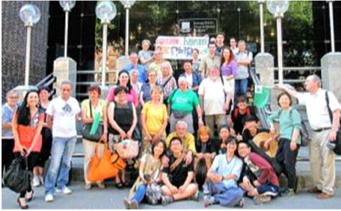
2014년 7월 느티울행복한학교 에스페란토여행 헝가리 편